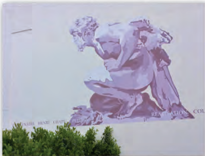
(Fresque murale d'après un dessin d'Henri Chapu, avenue de la Gare)

Pour le retour place Fruquier : descendre à droite après les jeux par une allée qui longe plusieurs beaux arbres. Après le mur d'enceinte, continuer la descente jusqu'à arriver sur le quai des Tilleuls. Traverser pour retrouver le parking.